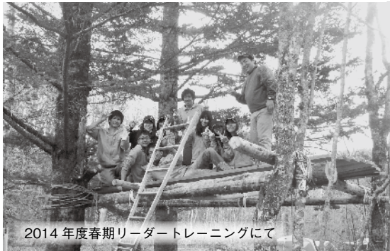
2014年度春期リーダートレーニングにて