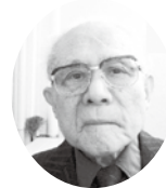
名古屋ワイズメンズクラブ