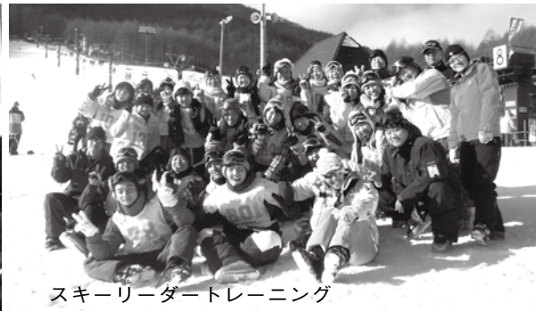
スキーリーダートレーニング