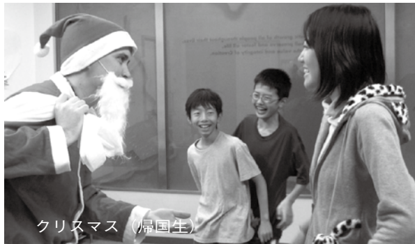
クリスマス(帰国生)