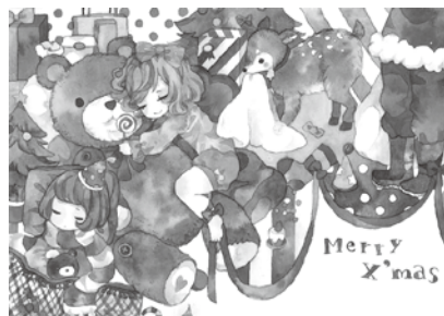
浅野 夢さんの作品

各ワイズメンズクラブのみなさんや会員、名古屋大学留学生の方々のボランティア協力の力もあり、以下のみなさんを特賞に選ぶことができました。