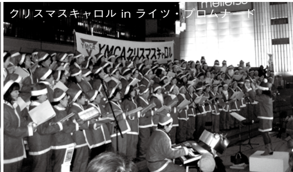
クリスマスキャロル in ライツ・ブロンナード